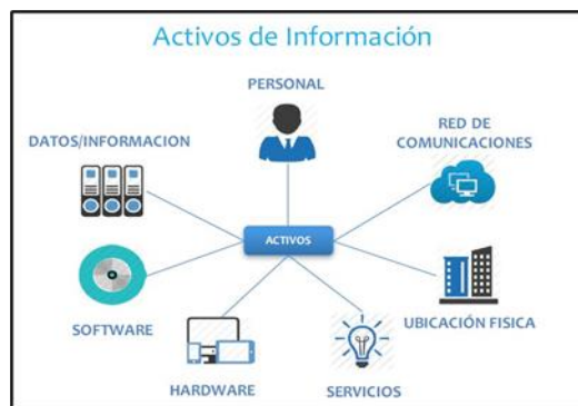
Figura 1: Activos de la Información.

Es un activo del negocio, tiene una función importante en la organización y por consecuencia debe estar protegido adecuadamente (ISO/IEC, 2014). La información puede ser clasificada de diversas formas, pero por la manera de comunicarse tenemos: Hablada en reuniones, impresa o escrita en papel, almacenada electrónicamente, transmitida por correo convencional o electrónicamente, Exhibido por videos corporativos. Los activos de la información son todo lo que tiene valor para la organización como: Software, servicios, intangibles como la reputación e imagen, personas y sus habilidades, certificaciones, Computadora, servidor etc.