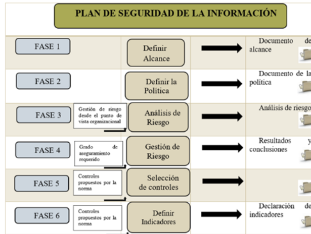
Figura 3: Plan de seguridad de la información.