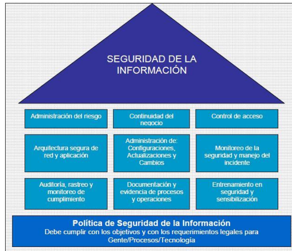
Figura 2: Proyectos que constituyen un SGSI. Fuente Gómez.

del negocio PNC (o sus siglas en inglés BCP-Business continuity plan ), integra el alcance y los objetivos de todos estos enfoques [6].